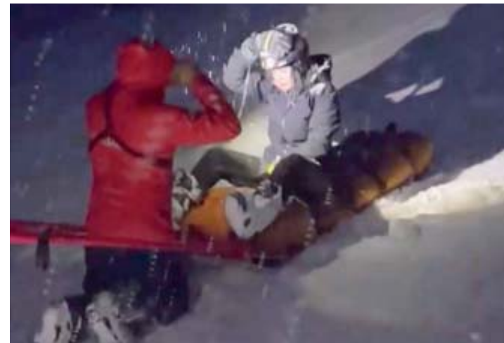
La jeune femme a fini sa journée de ski par une virée fortuite en luge.